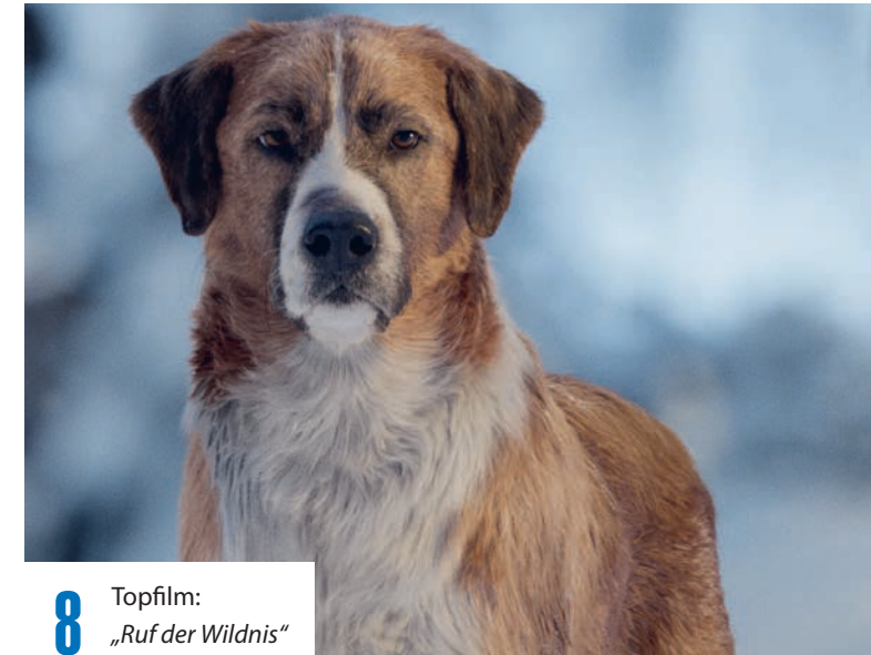
8 Topfilm: „Ruf der Wildnis“