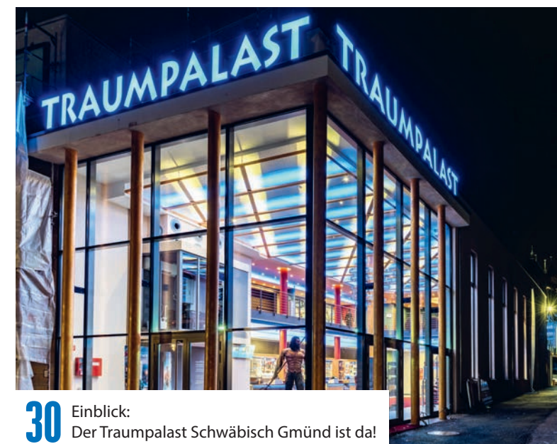
30 Einblick: Der Traumpalast Schwäbisch Gmünd ist da!