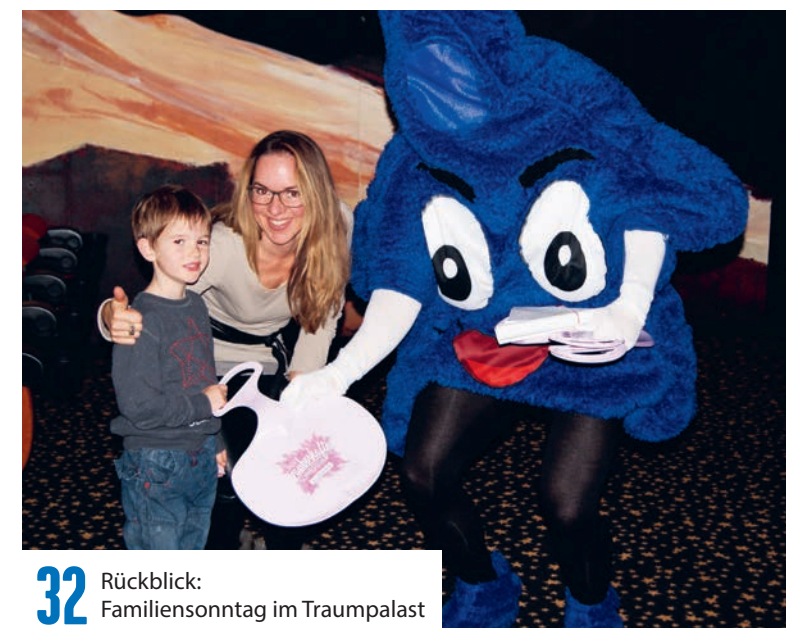
32 Rückblick: Familiensonntag im Traumpalast